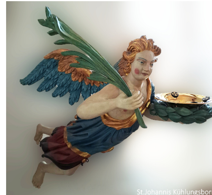
St. Johannis Kühlungsborn