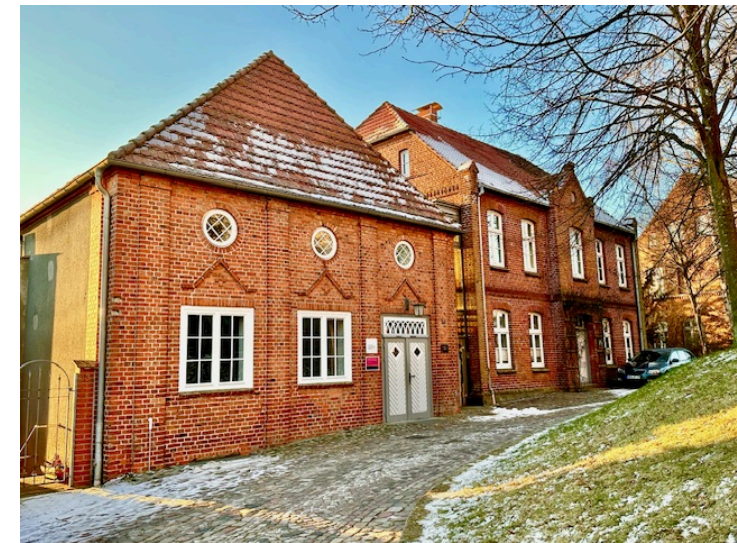
Gegenüber der Kirche befinden sich das Gemeindehaus (links) und das Kantorenhaus.