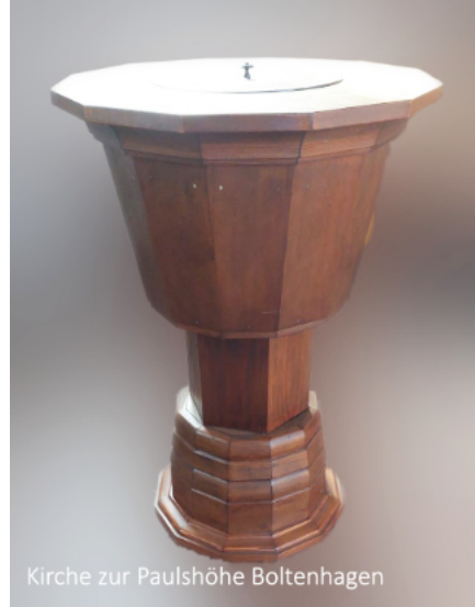
Kirche zur Paulshöhe Boltenhagen

Unser Taufbecken mit seinen 3 Beinen ist besonders schön mit einem Efeukranz und eingesteckten Blumen zu Geltung zu bringen, zwar ist dann der schöne mit Schrift geprägte Taufsteinrand nicht zu sehen, aber die Kinder haben was zu gucken und sind etwas abgelenkt. Ach ja, auch eine Fußbank, ein kleiner Tritt, gern mit 2 Stufen,