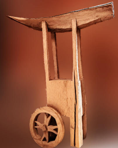
Mobile Taufe der Kirchengemeinde Wismar Heiligengeist St. Nikolai