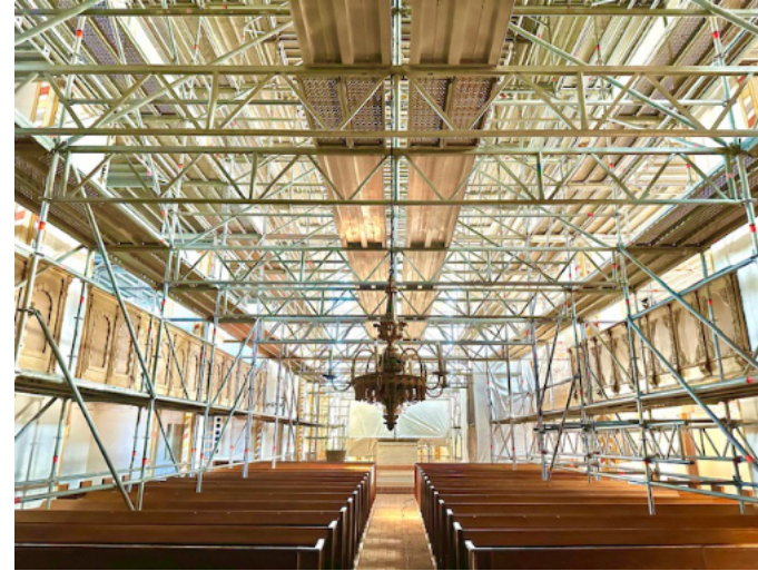
Zurzeit ist die Kirche wegen Renovierungsarbeiten voller Gerüste.

Weit über die Grenzen von Mecklenburg-Vorpommern hinaus ist ein Festival bekannt, zu dem die Kirchengemeinde alljährlich einlädt.