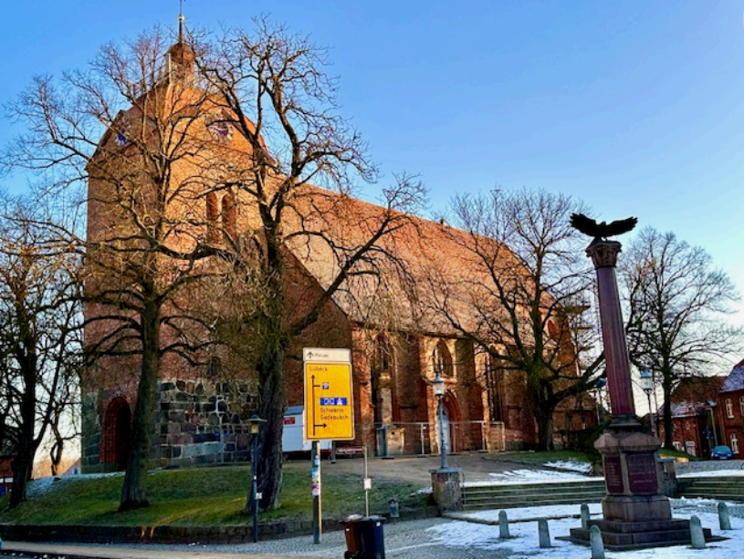
Mitten in Schönberg steht seit dem 14. Jahrhundert die Sankt-Laurentius-Kirche.