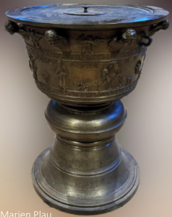
St. Marien Plau