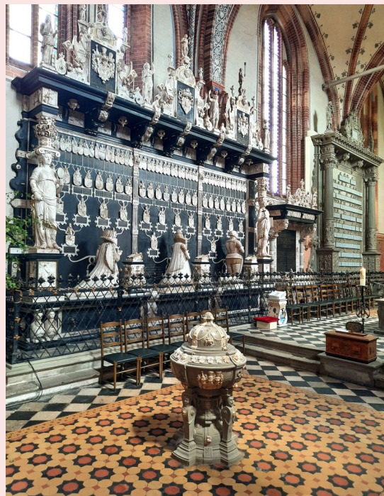
Herzog-Ulrich-Monument an der Nordwand des Domes

16:00 Uhr Dom Thematische Führungen durch den Dom: