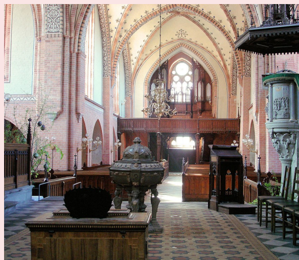
Langhaus vor der Restaurierung 2009

AG für Mecklenburgische Kirchengeschichte c/o Landeskirchliches Archiv Am Dom 2, 19055 Schwerin Tel. 0385/20223-290, Fax –299 peter.wurm@archiv.nordkirche.de