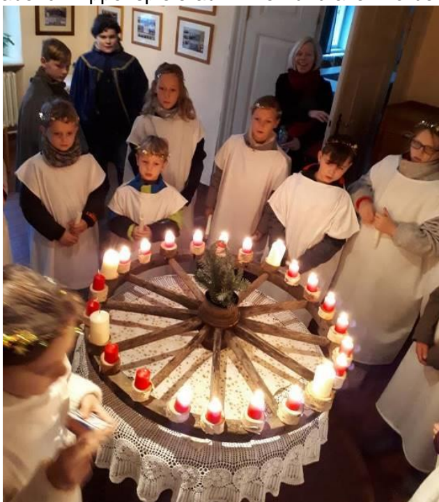
Krippenspieler in Neuenkirchen vor dem Wichern-Adventskranz im Pfarrhaus

In den Christvespern sammelten wir die Kollekte wie jedes Jahr für die Aktion „Brot für die Welt.“ Diesmal kam dabei ein Betrag von 2.228,09 € zusammen. Vielen Dank allen, die mit ihrer Gabe dazu beigetragen haben!