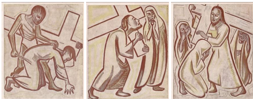
Wilhelm Niedermayer: Kreuzwegstationen (Kirche von Nammering, Niederbayern)

Mittwoch 10. April in der Kirche Neuenkirchen.