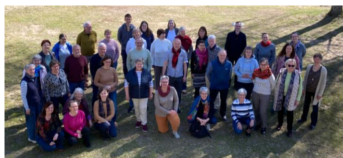
der Kantatenchor beim Proben-Wochenende in Mirow im April 2026

Vocalensemble St. Marien Mo 19.30-21 Uhr Gemeindehaus, Unterwallstr. 21