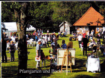
Pfarrgarten und Backhaus