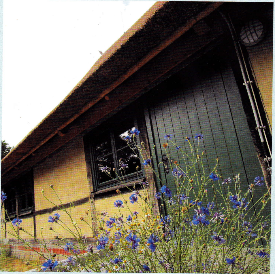
Hörspiel- und Begegnungsscheune Cramon