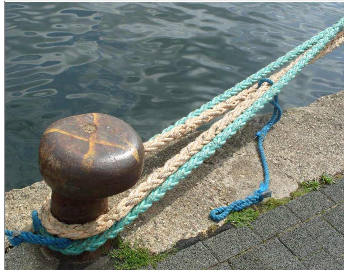
Taue am Kai. Festmachen.