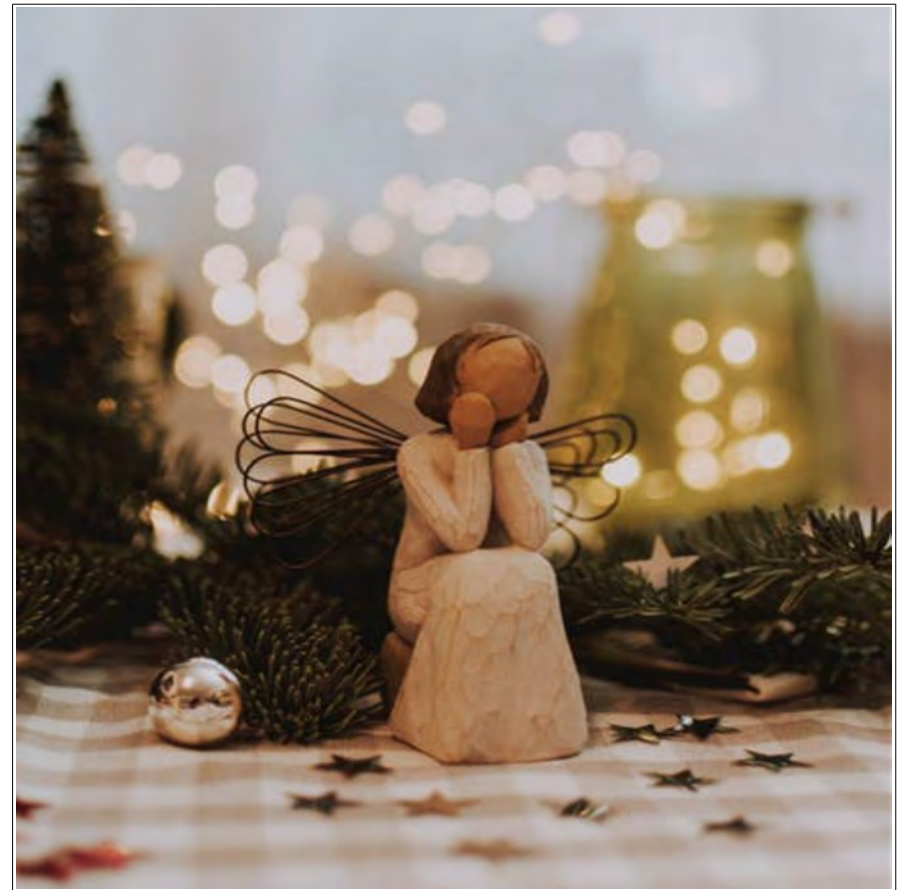
Wartender Engel. Und auf was warten Sie?