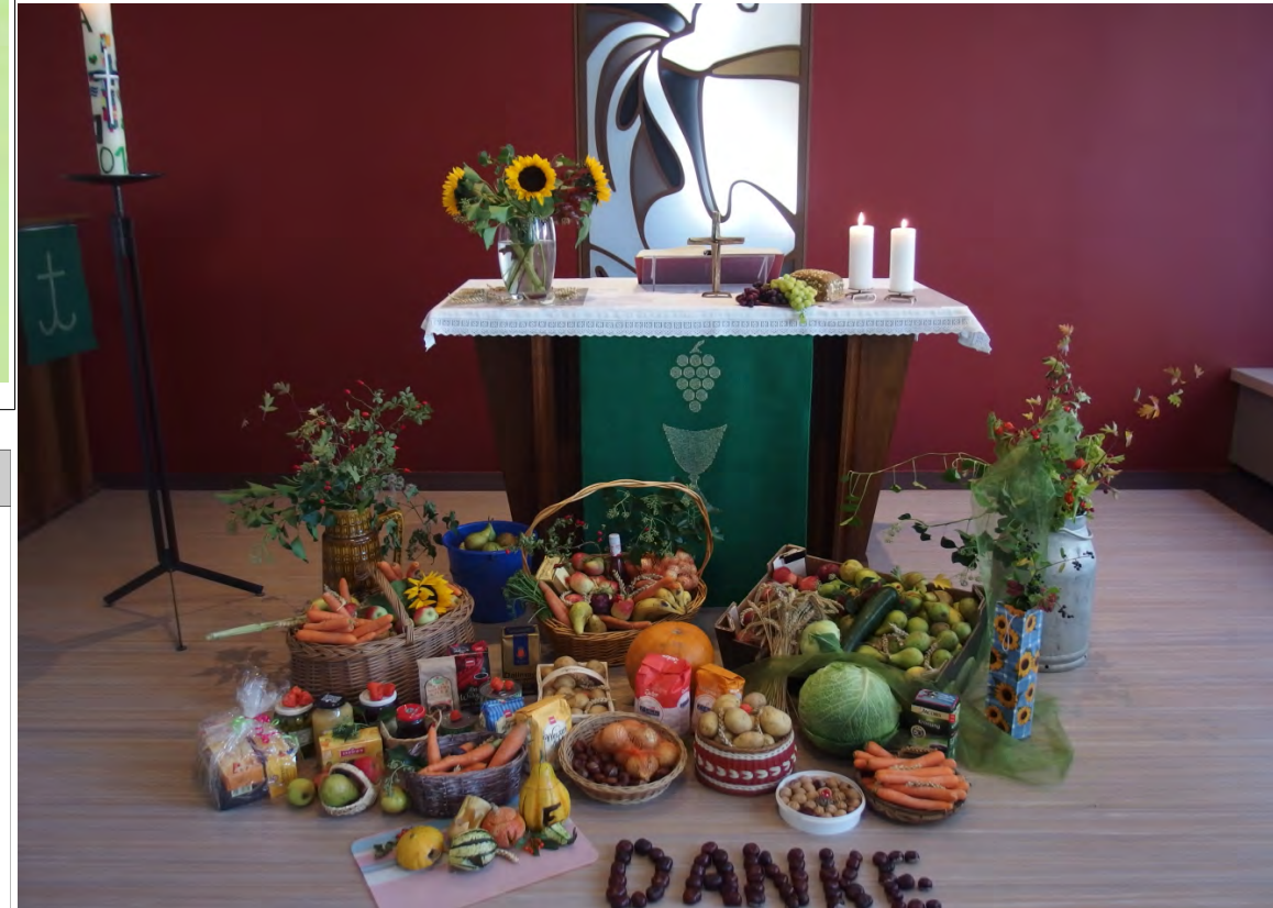
Erntedank 2018 in St. Thomas, Foto: Uta Banek

Gemeindekirchgeldkonto St. Thomas Rostock-Lichtenhagen IBAN: DE24 5206 0410 7506 5000 64 BIC: GENODEF1EK1 Evangelische Darlehensgenossenschaft Kiel eG Bitte geben Sie bei Onlineüberweisungen Ihre Kirchgeldnummer, Vor- und Nachname, und Ihre Straße + Hausnummer mit an.