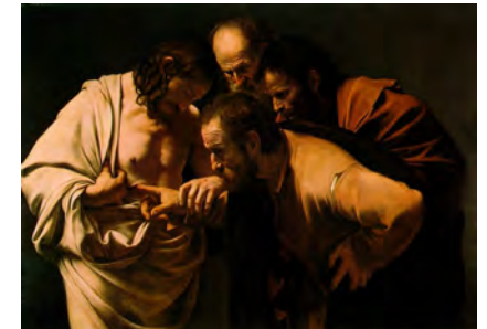
Foto (Caravaggio – der ungläubige Thomas und der auferstandene Jesus):