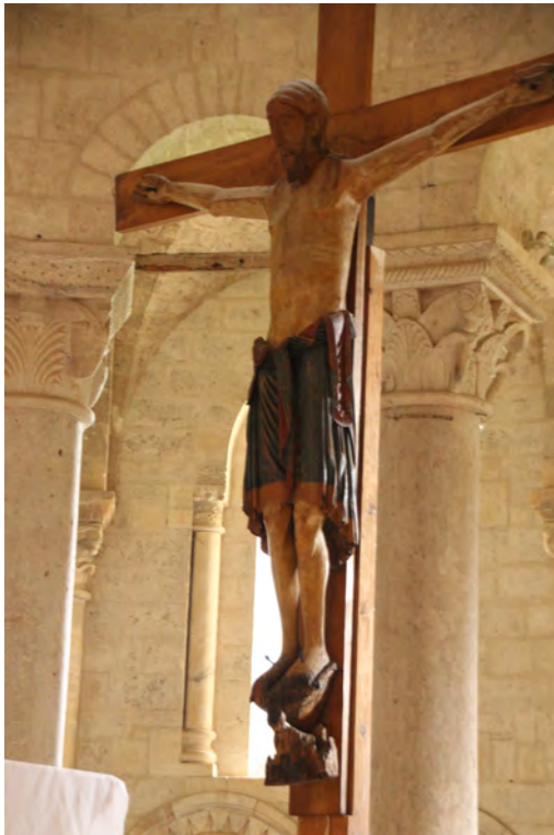
Kruzifix in der Abtei Sant´Antimo, Montalcino (Italien)