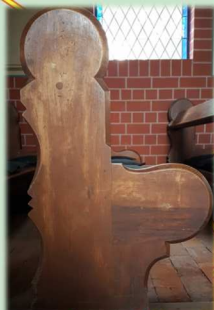
Stuhlwange in der Kapelle Jürgenshagen