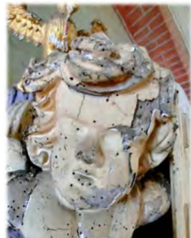
Detail des Schalldeckels der Kanzel

Viele der barocken Schnitzereien sind deutlich gefährdet. Kleinere Verzierungen haben sich gelöst, bereits seit Jahren sammeln wir diese Einzelteile in einer „Kanzel-Schatzkiste“. Nun sammeln wir in diesem Frühjahr mit unseren „Kanzelschatz“-Sammeldosen Ihre Beiträge zu dieser Restaurierung und sind dankbar für jede kleine Spende.