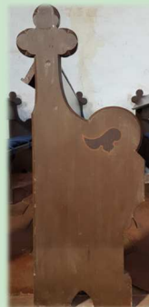
Stuhlwange in der Kirche Hohen Luckow