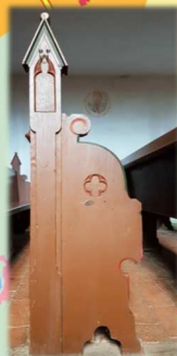
Stuhlwange in der Kirche Bernitt