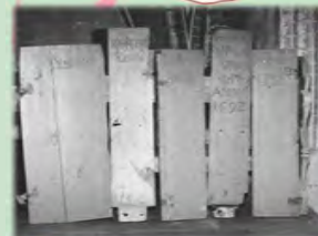
Historische und heutige Stuhlwangen in der Kirche Neukirchen