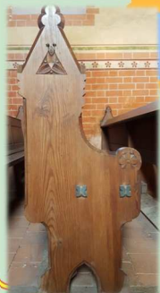
Stuhlwange in der Kirche Moissall