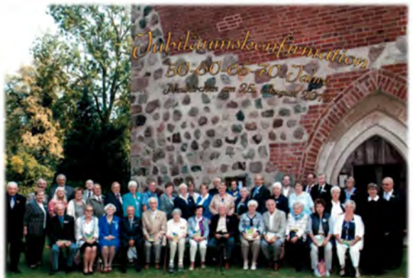
Jubelkonfirmation 2019 in Neukirchen

Dazu sind alle diejenigen eingeladen, die im Jahr 1970 (goldene Konfirmanden), 1960 (diamantene Konfirmanden), 1955 (eiserne Konfirmanden) und 1950 (Gnaden-Konfirmanden) in Neukirchen, Moissall oder Bernitt konfirmiert worden sind, und auch diejenigen, die in den