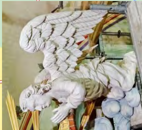
Knieender Engel am Altar der Kirche Neukirchen