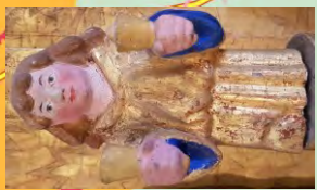
Handlockenengel vom Altar in der Kirche Bernitt