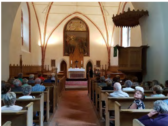
Zu Gast in der Kirche von Hohen Mistorf

So schön, as in uns olle Heimat Meckelborg mit ehre 650 Kirchen is`t nirgens up de ganze Welt!