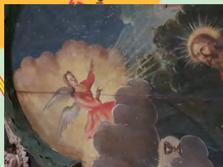
Engel im Altargemälde der Kirche Moissall