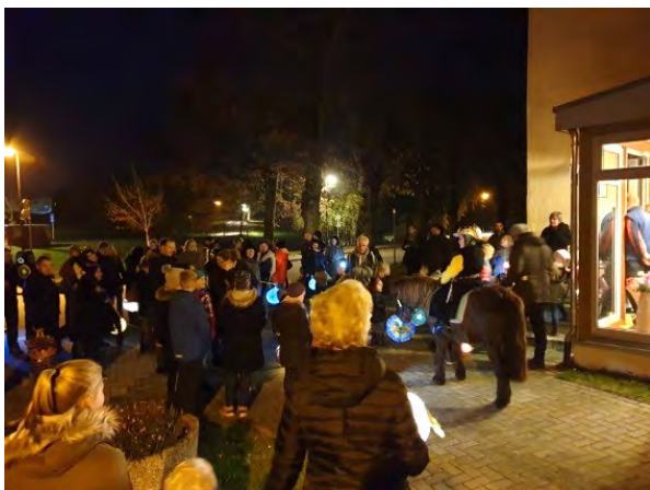
An der Dampfbäckerei Dopp in Jürgenshagen (Station beim Martinsumzug 2019)