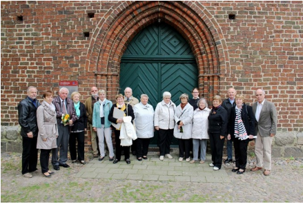
Die Jubelkonfirmanden dieses Jahres