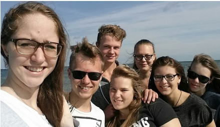
Die Junge Gemeinde unterwegs in Warnemünde