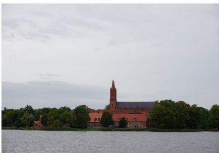
Ein schöner Tag im Kloster Dobbertin