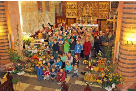
Ein gutes Stück St. Marien beim Erntedankfest