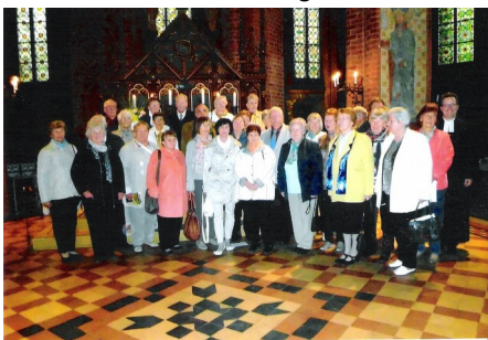
Ein großer Teil der Jubilare dieses Jahres