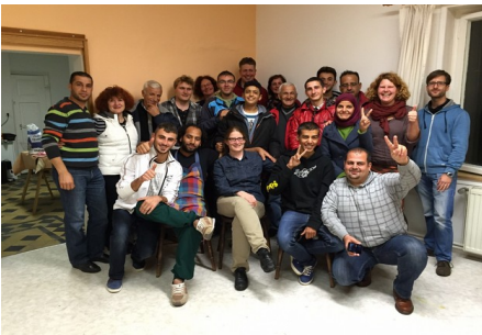
Kochen mit Flüchtlingen in der Mühlenstraße

Auch im November lädt der Bauförlderverein der St. Marienkirche zu einem Kirchenkaffee mit Musik in die geheizte Winterkirche ein. Am 08.11. ab 15.00 Uhr ist der Slater Posaunenchor zu Gast. Unter der Leitung von Marko Schirrmeyer erklingen altbekannte Choräle und Kirchenlieder, sowie neue, mitreißende Stücke im Blärsound. Der Bauförlderverein bietet ein Buffet mit frisch gebackenem Kuchen an, dazu fair gehandelten Kaffee, Tee und Saft – eine Gelegenheit für die ganze Familie. Alle Spendeneinnahmen kommen der Baukasse zugute. Volker Schubert