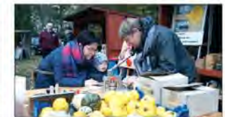
Mit viel Spaß und Kreativität wurde gebastelt und gemalt