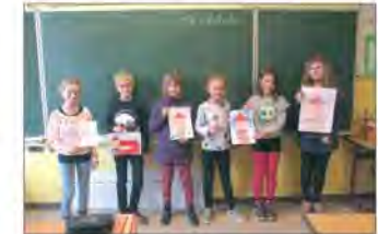
Stolz zeigen die Kinder ihre selbst getöpften Ziegelsteine und ihre Zeichnungen