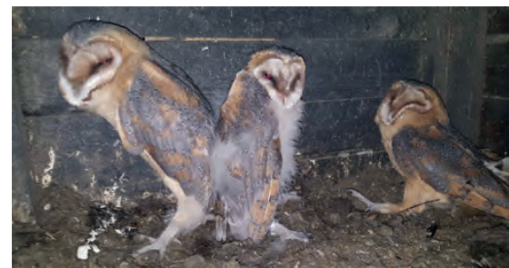
Unsere drei jungen Schleiereulen in der Kirche.

Es ist schön, dass diese Population wieder langsam zunimmt.