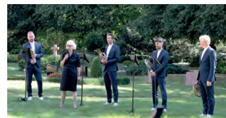
Festspielkonzert mit dem Hornquartett „german hornsound“ am 6. August vor der Beidendorfer Kirche.