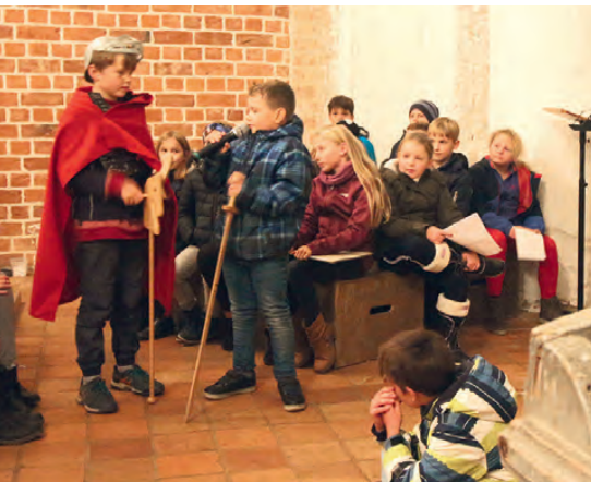
Martinsfest in Lübow.

In Dorf Mecklenburg: am Mittwoch, 11. November, um 17.00 Uhr