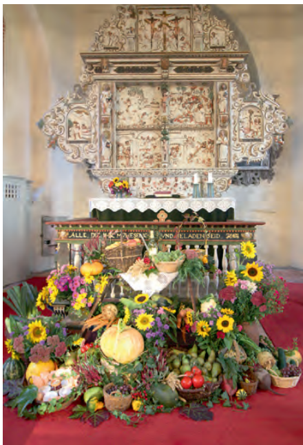
Erntedankaltar Dorf Mecklenburg.

Wir laden Sie herzlich zur Feier unseres Familiengottesdienstes zum Erntedankfest ein. Geplant hatten wir diesen Gottesdienst im Rahmen der 1025-Jahr-Feier Dorf Mecklenburgs. Nun feiern wir nicht auf dem Sportplatz, sondern in der Kirche. Erntedankgaben können Sie gern in der Woche zuvor in der Veranda des Pfarrhauses abgeben oder am Samstag, den 12. September um 9.00 Uhr in die Kirche bringen.