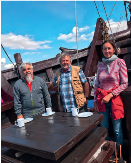
Abschiedstour unter Kollegen mit der Poeler Kogge „Wisseмара“.