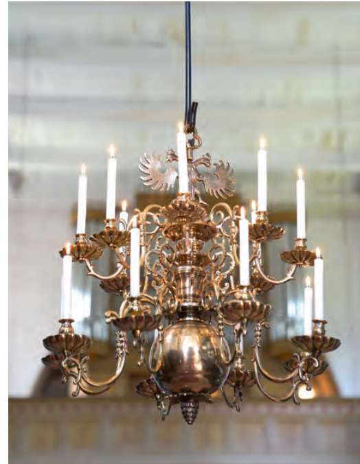
Der restaurierte Leuchter in der Lübower Kirche.

Mitte Juli konnte der Kronleuchter in die Kirche zurückkehren. Er wurde bei den Bauarbeiten beschädigt und musste restauriert werden. Der Leuchter bekam auch eine passende Aufhängung und strahlt nun in neuem Glanz.