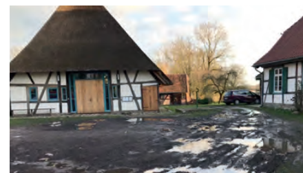
Unser Pfarrhof wird im Herbst saniert.

Im Herbst kann nun endlich der Pfarrhof saniert werden. Die Firma Rumpf aus Rampe wird diese Arbeiten durchführen. Infolgedessen bitten wir Sie, Ihr Auto vor dem Pfarrgelände zu parken. Wir hoffen darauf, in diesem Winter trockenen Fußes über den Pfarrhof zu kommen.