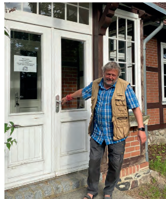
Abschied vom Pfarrhaus.

Unser Leben besteht aber nicht nur aus Problemen, Konflikten und Schwierigkeiten. Einer der mir wichtigen Aspekte in der Gemeinde- und