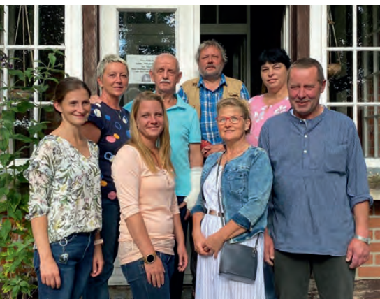
Danke an den tollen Kirchengemeinderat.