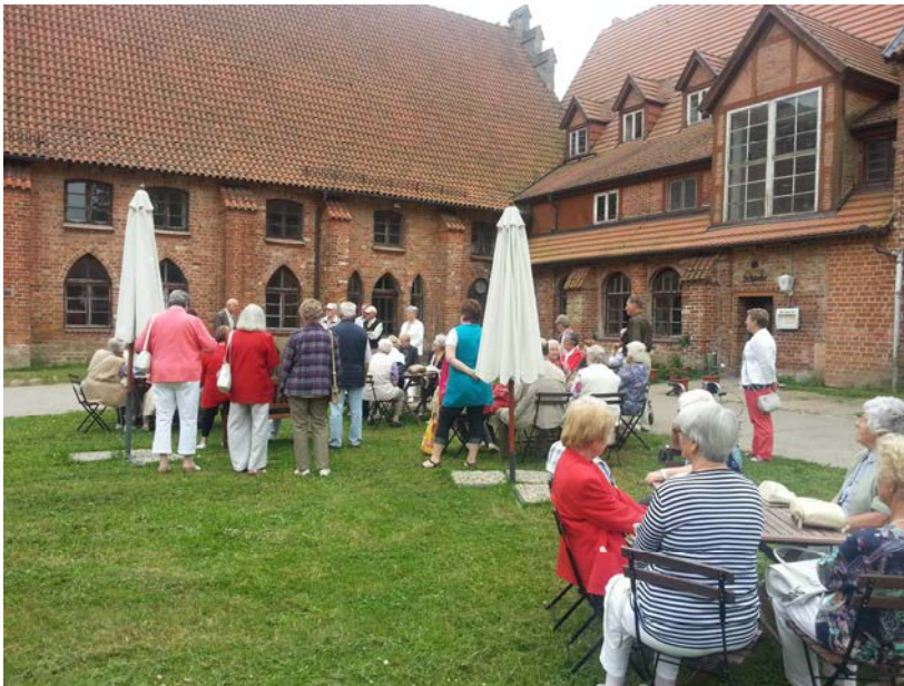
Ausflug des Kreises für Ältere zum Kloster Rühn

- in Barnin an jedem 2. Mittwoch eines Monats um 15:00 Uhr - in Kladow an jedem letzten Mittwoch eines Monats um 15:00 Uhr