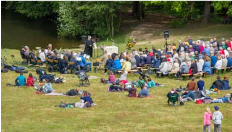
Himmelfahrt in Kösterbeck 2019