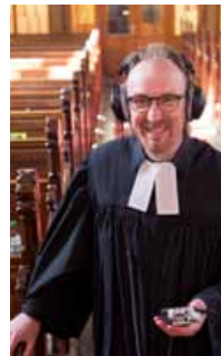
Kontrolle der Gottesdienstaufnahme in digitalen Zeiten