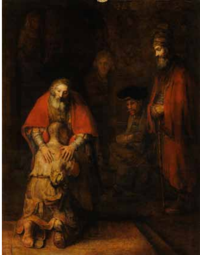
Gemälde von Rembrandt van Rijn, „Die Rückkehr des verlorenen Sohnes“ (1669), derzeit zu sehen in der Eremitage in St. Petersburg

Das heißt doch für uns alle, die wir das glauben wollen, dass wir bei Gott einen Platz, ein Zuhause haben dürfen. Mit dem Gleichnis vom Verlorenen Sohn, versuchte Jesus zu Lebzeiten den Menschen, die ihm zuhörten, begreiflich zu machen, wie Gott als Vater zu verstehen sein könnte. Wie er sich uns Menschen gegenüber verhält. Für die Schriftgelehrten war es ja schon ein Affront, dass Jesus, wenn er mit seinem Vater im Himmel redete, ihn mit abba, also in unserem Sprachgebrauch „Papa“ ansprach. Damals war das undenkbar so mit Gott zu reden, denn den Juden war schon das Aussprechen von Gottes Namen