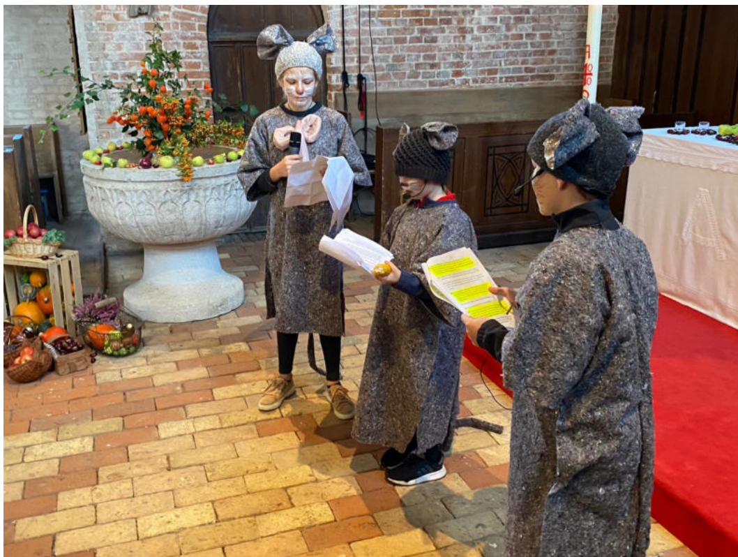
Erntedankfest - Die drei Mäuse erzählen aus ihrem Leben.