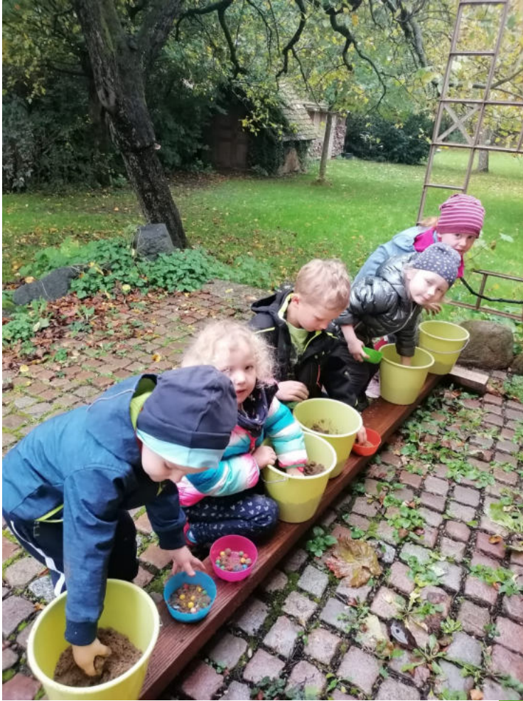
Die Kirchenknirpse in Aktion.