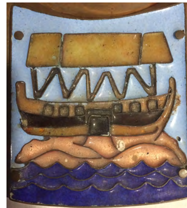
Kirche Ranzin, Detail Taufschale

Kirchenmusik: Kantorin Gerhild Heller 038355-719933 https://www.kirche-mv.de/zuessow-zarnekow-ranzin