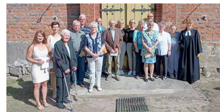
Jubelkonfirmation 2022 in Schmarsow

Am 28. August feierten wir in Schmarsow eine schöne Jubelkonfirmation. Im kommenden Jahr soll nun wieder in Kartlow gefeiert werden, nämlich am Sonntag zu Trinitatis, den 4. Juni. Gerne können Sie sich schon jetzt dafür anmelden. Herzlich