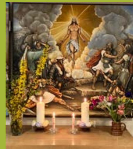
Altarbild von Thomas Voigtländer im Kartlower Pfarrhaus

Wie im vergangenen Jahr wollen wir die besonderen Tage vor und um Ostern gemeinsam begehen. So laden wir am Gründonnerstag wieder zu Andacht und Grüner Suppe ein, diesmal nach Schmarsow. Karfreitag bedenken wir das Sterben Jesu in der Völschower Kirche. Seine Auferstehung wollen wir wieder ganz früh am Ostermorgen in der Kartlower Kirche erfahren und laden im Anschluss zum kleinen Kaffee und Osterbrot ins Pfarrhaus, bevor jeder mit seinen Lieben zuhause hoffentlich eine gesegnete und schöne Osterfreude erleben kann!