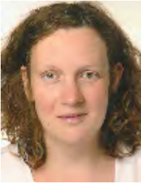
Brunke Ziemann