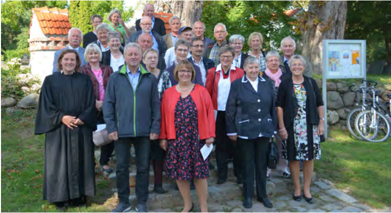
Konfirmationsjubiläum der Jahrgänge 1969-72 in Groß Bisdorf