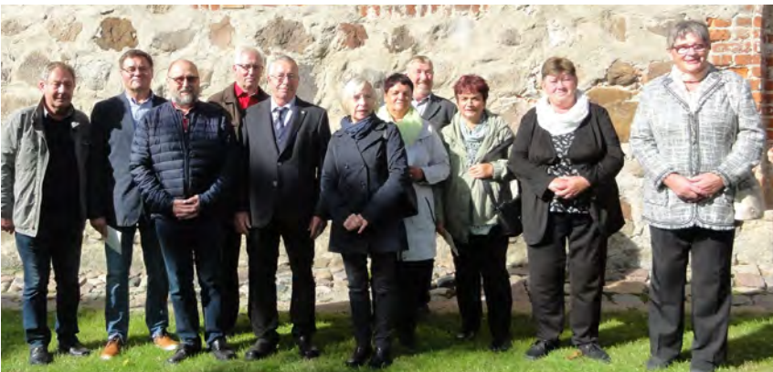
Konfirmationsjubiläum der Jahrgänge 1969-72 in Kreuzmannshagen