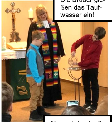
Die Brüder gie- ßen das Tauf- wasser ein!

Rückblicke: Konfi-Taufen Was war früher besser als heute? Und was ist heute besser als früher? Wie sehen dies jüngere oder ältere Menschen und was sagt die Bibel zum Thema...? All das fragten die KonfirmandInnen in ihrem Vorstellungsgottesdienst, in dem sie erkennen ließen, was auch sie selbst dazu meinen. Dabei zeigten sie ihre erworbenen Kompetenzen. „Beeindruckend“,