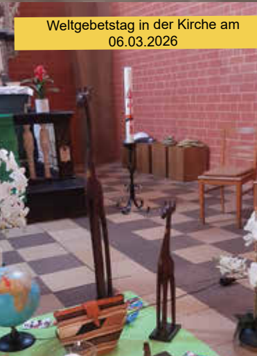
Weltgebetsstag in der Kirche am 06.03.2026