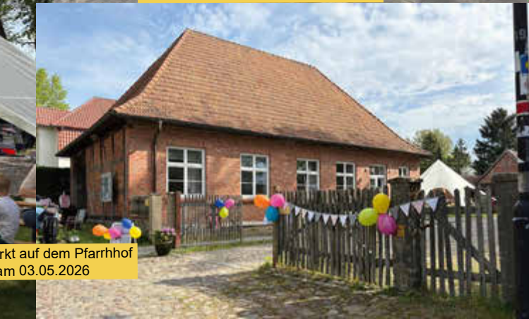
markt auf dem Pfarrhof am 03.05.2026