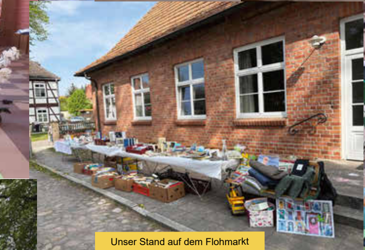
Unser Stand auf dem Flohmarkt