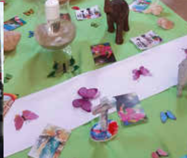
Rückblicke März - Mai 2026