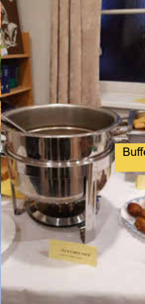
Buffet am Weltgebetsstag am 06.03.2026