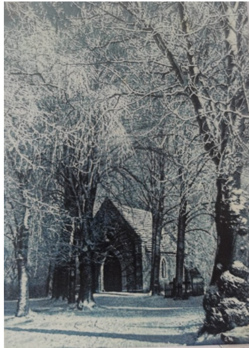
Die alte Kapelle im Ehrenhain wurde am 28.11.1977 abgerissen.

abgeräumt. Mit ihnen gehen wertvolle Zeugnisse vergangener Zeiten verloren. Darum ist der Erhalt und die Pflege unseres Friedhofes und die Schaffung würdevoller Begräbnismöglichkeiten eine wichtige Aufgabe, die unsere Kirchengemeinde in Zusammenarbeit mit der Stadt und allen, die diese Orte schätzen, verwirklichen möchte.