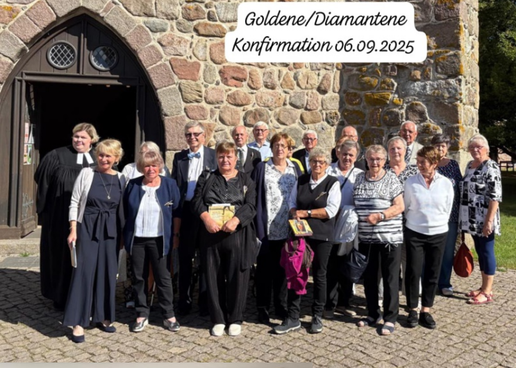
Goldene/Diamantene Konfirmation 06.09.2025