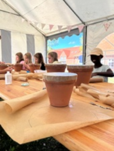
Rückblicke September - November 2025