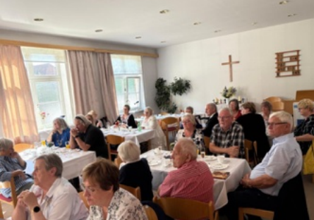
Jubelkonfirmation am 06.09.2025 ----- Kindermusikfreizeit Auftritt am 05.09.2025

Gottesdienst unter den Linden * Kindermusikfreizeit * Musikalische Andacht mit der Kantorei Niendorf * Kirchenputz * Erntedankfest