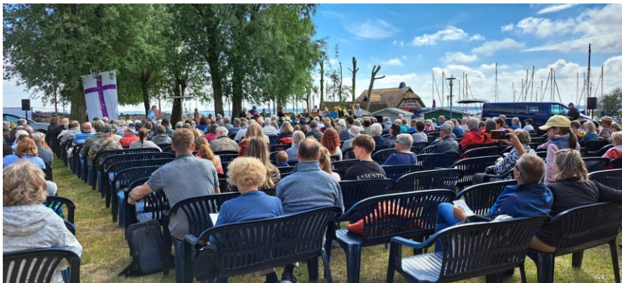
Hafengottesdienst am Pfingstmontag in Dierhagen

„Der Herr behüte deinen Ausgang und Eingang von nun an bis in Ewigkeit.“ Psalm 121, 8