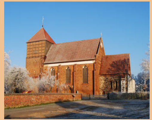
Die Kirche in Mestlin war auf dem Suchbild. Die Gewinnerin ist Silke Eggert. Sie erhält den „Mecklenburgischen Kirchenkalender 2022“.

scheiben und mit verzierten Schlusssteinen geschmückt. Der Turm wurde erst 1749 noch einmal um zwei Stockwerke erhöht und mit einem Pyramidendach geschlossen. Hier befinden sich zwei wertvolle alte Glocken, die in den Jahren 1389 und 1531 gegossen wurden. Sie kamen Ende der 1980er Jahre aus der Ruester Kirche hierher. Ein Aufstieg auf den Turm lohnt sich, denn von hier bietet sich ein Blick in die Weite der mecklenburgischen Landschaft und den Ort Mestlin.