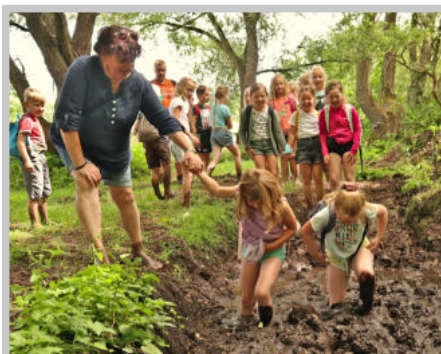
Abenteuer in Plau Weitere Fotos und Erinnerungen auf www.woosten.de

den und spielten im Freien. Außerdem war für jede der drei Gruppen ein Tagesausflug organisiert. Die erste Gruppe verbrachte einen tollen Tag in Plau am See. Los ging's auf dem Barfußpfad, der ei-