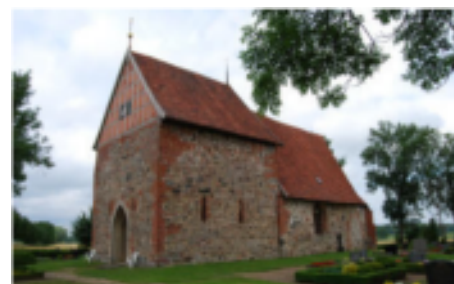
Wer kennt die Kirche? (Die Auflösung finden Sie auf Seite 20.)