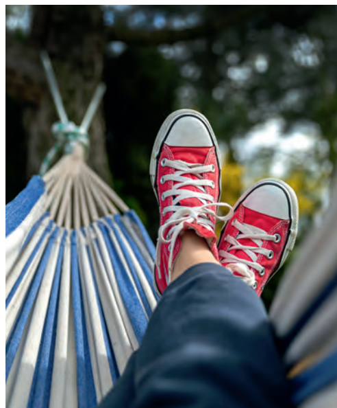
camia von fotyma von Getty Images