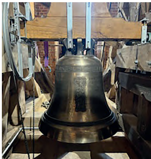
Die neue Glocke in neuem Joch.

Wir haben am 6. April die neue Glocke das erste Mal offiziell in Dienst gestellt und das mit einem Glas Sekt und einem An-Läuten begangen. Wie schön, dass auch Mitglieder der Familie von Thomas Agerholm gekommen waren, sowie der Stiftung und der HW-leasing.