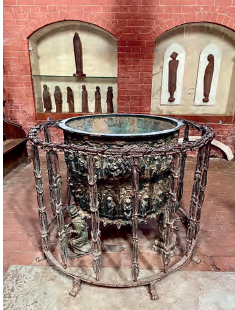
Taufbrunnen mit „Teufelsgitter“ aus St. Marien

Eintritt: 15 € (freier Eintritt für Kinder bis 14 Jahre)