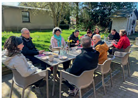
Mittag in der Sonne

Wie in jedem Jahr traf sich der Kirchengemeinderat zu einer längeren Zusammenkunft, einer Klausur. In diesem Jahr waren wir ganz in der Nähe auf dem Boiensdorfer Werder untergebracht. Immer gehört zu unserer Klausur auch ein geselliger Abend, an dem wir aneinander noch immer neue Seiten entdecken und außerhalb von Protokoll und Sitzung miteinander klönen.