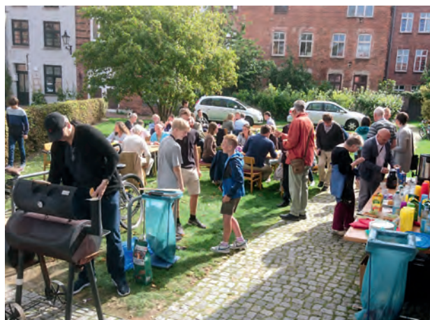
Willkommensfest an der Neuen Kirche.

Das Gegenstück zur Abschiedsfest ist das Willkommensfest im September, auf das wir hier schon hinweisen wollen. Willkommen heißen werden alle, die neu beginnen – als Schulanfänger, als Studies, neu in der Gemeinde, in Wismar oder einfach nur neu anfangen nach der Sommerpause. Dieser Tag hat sich zu einem besonderen Fest entwickelt. Daher freuen wir uns sehr über Kuchenspenden und Mithilfe bei Vor- und Nachbereitung.