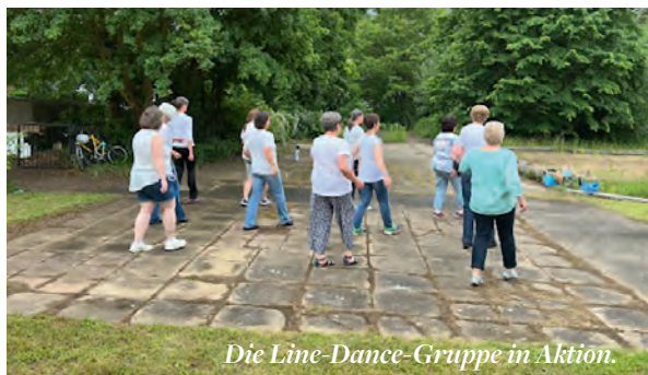
Die Line-Dance-Gruppe in Aktion.