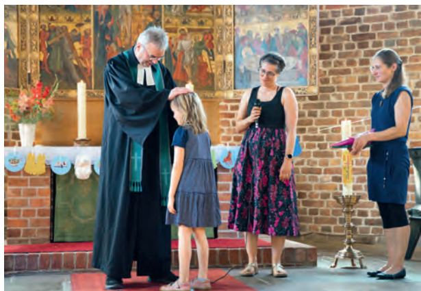
Abschied und Segnung der Schlaufuchskinder.

Wir freuen uns sehr, mit der Schulstiftung der Evangelisch-Lutherischen Kirche in Norddeutschland einen neuen Träger und eine bewährte Partnerin gefunden zu haben.