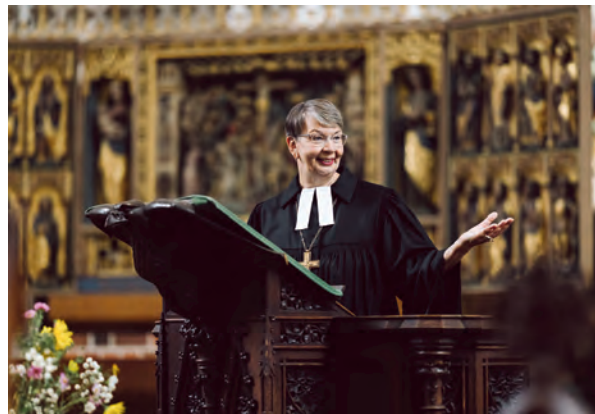
Predigt: Landesbischöfin der Nordkirche Kristina Kühnbaum-Schmidt