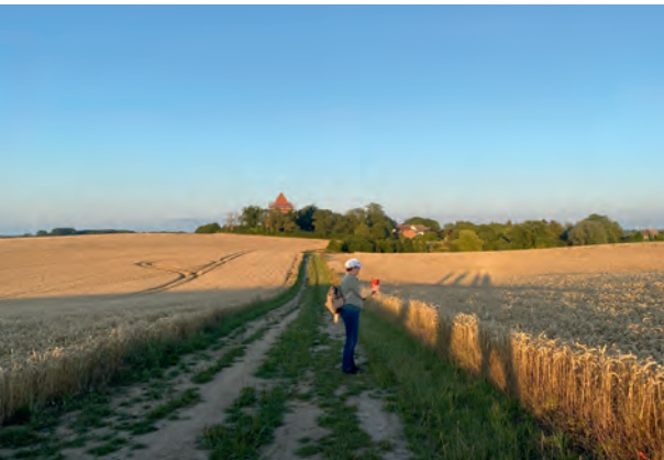
Pilgerwanderung um Hohenkirchen.