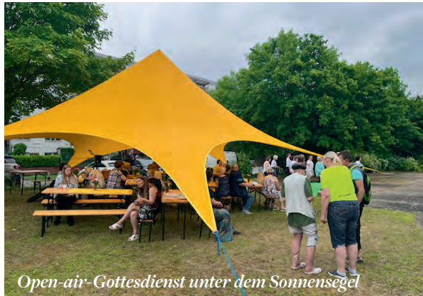
Open-air-Gottesdienst unter dem Sonnensegel