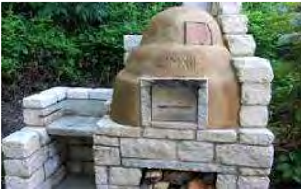
So könnte er aussehen, der Backofen, aber ich bin mir sicher: er wird viel schöner!

Also, wenn Sie bei diesem Projekt dabei sein wollen, dann melden Sie sich bei mir während meiner Sprechstunde mittwochs von 16.30 – 17.30 Uhr oder beim Vorstand des Heimatvereins und erfahren mehr über unser gemeinsames Projekt – und vor allem: wann es losgeht.