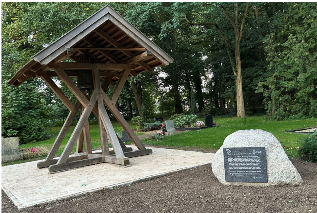
Neben dem Glockenstuhl auf dem Selmsdorfer Friedhof befindet sich nun die Spendertafel mit den Namen der Unterstützer.