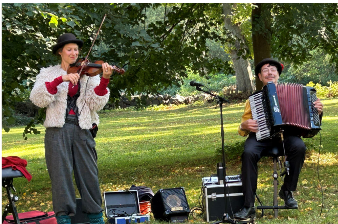
Das Duo "Knopf und Zopf" begeisterte auf dem Selmsdorfer Kirchengemeindefest viele Besucher.