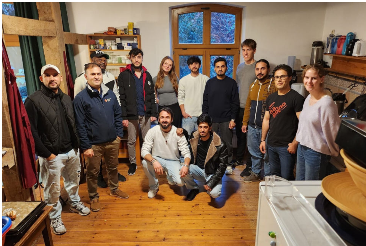
Die Junge Gemeinde lud Bewohner der Selmsdorfer Flüchtlingsunterkunft ins Pfarrhaus ein. Sie haben gemeinsam gekocht und viel erzählt.