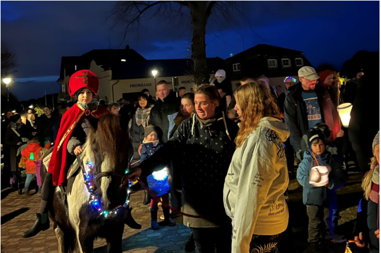
Sankt Martin ritt am 11. November durch die Straßen von Selmsdorf und teilte in der Kirche seinen Mantel mit einem Bettler.