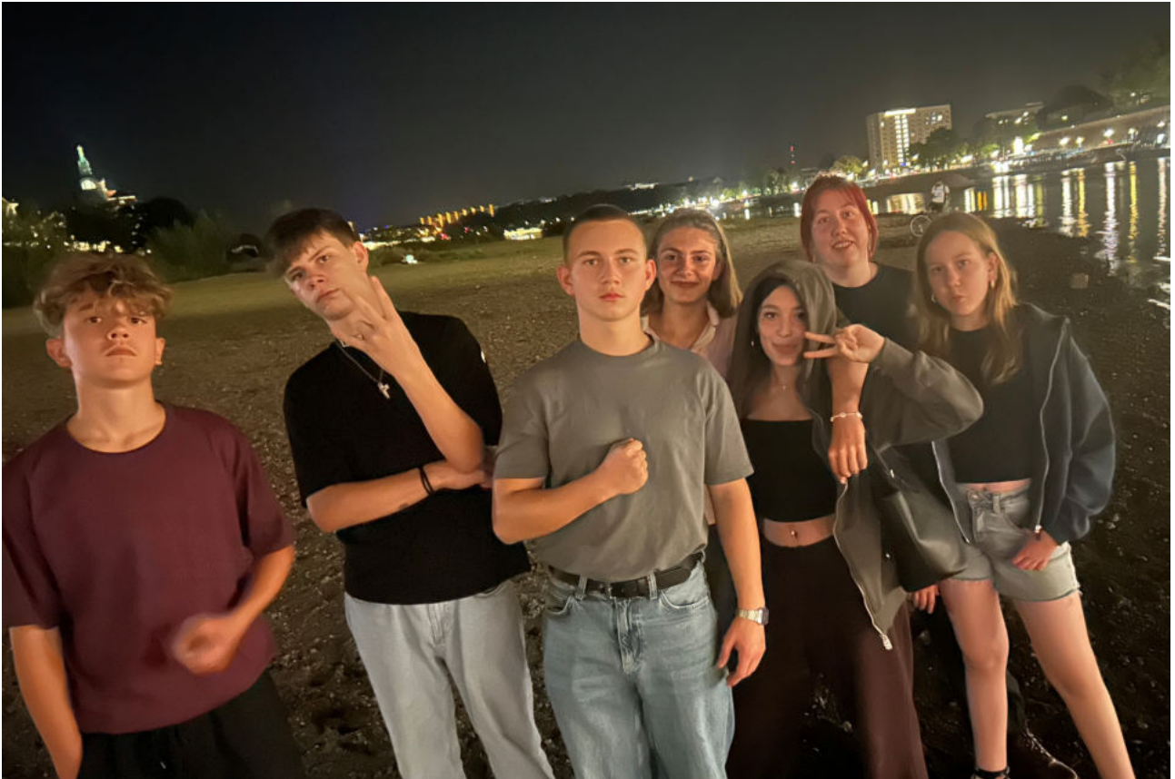
Gemeinsam besuchten wir die Frauenkirche und waren fasziniert vom beleuchteten Elbufer am Abend.