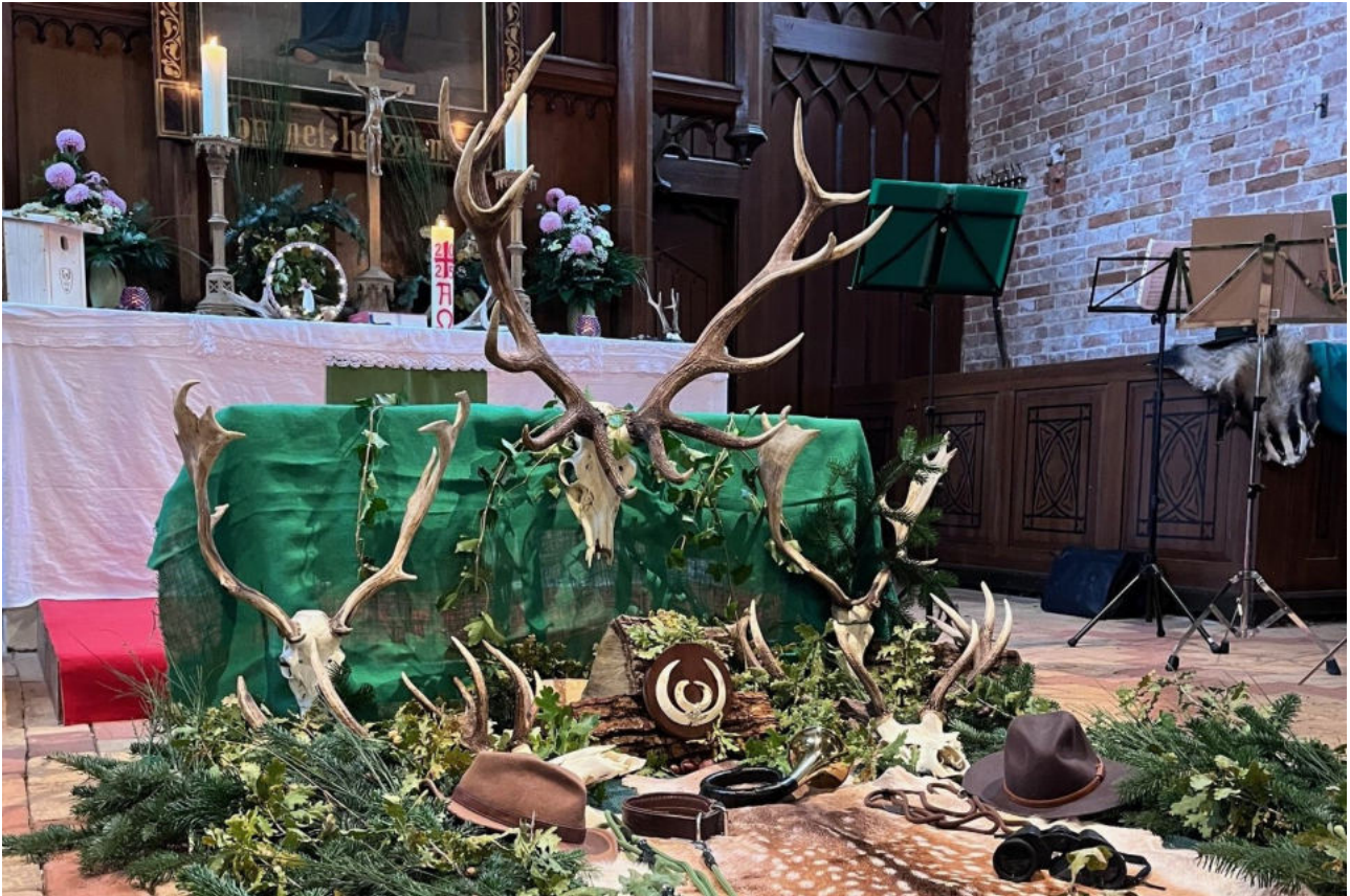
Die Jagdhornbläser des Hegerings Schönberg begleiteten auch in diesem Jahr unsere Hubertusmesse.