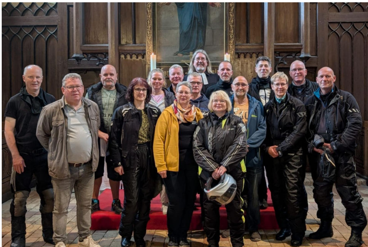
Auch in diesem Jahr feierten die Biker vor ihrer Pfingsttour in den Spreewald eine Andacht in der Selmsdorfer Sankt Marienkirche.