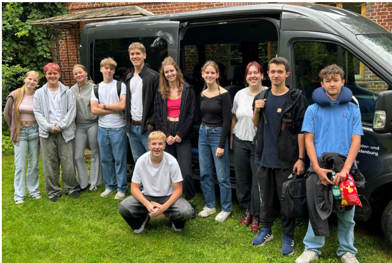
Unsere Jungen Gemeinde kurz vor der Abfahrt zur Bildungsreise nach Dänemark.