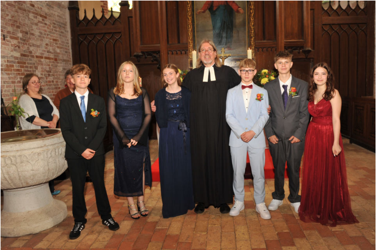
In diesem Jahr feierten sechs Jugendliche unserer Kirchengemeinde am Pfingstsonntag ihre Konfirmation.