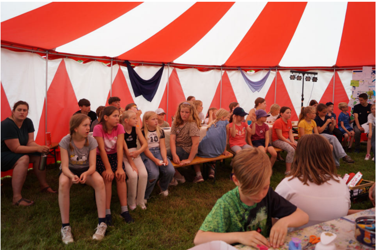
Zur Eröffnung des Kinder - Bibel - Camps trafen sich alle Teilnehmer im großen Zirkuszelt in Roggenstorf.