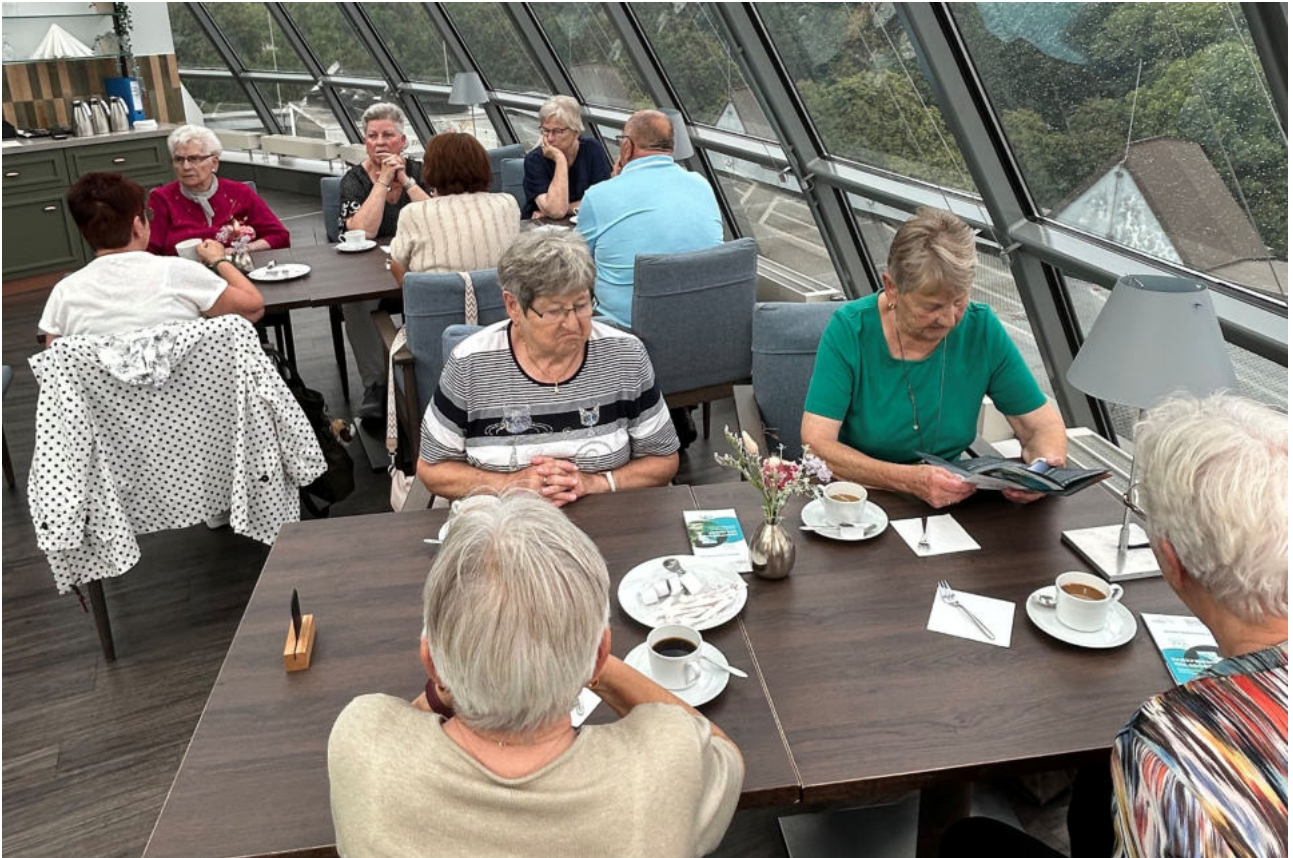
Hoch über dem Hamburger Hafen konnten wir am Nachmittag Kaffee und Kuchen genießen.