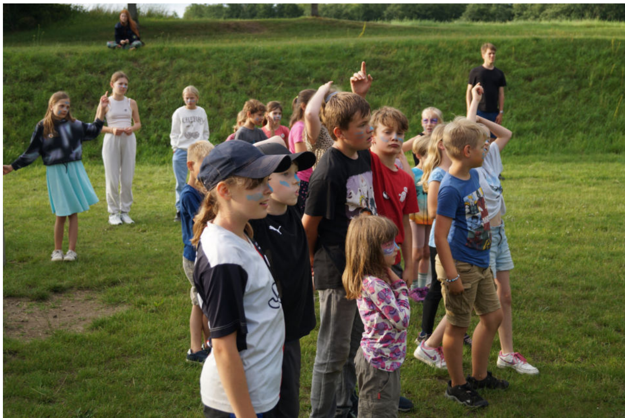
Auf dem Roggenstorfer Sportplatz fand das große Spiel "Capture the flag" statt. Zwei Mannschaften mussten jeweils die gegnerische Fahne erobern.