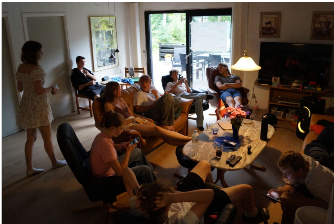
In Hojslev, im Norden Dänemarks, verbrachten elf Jugendliche unserer Jungen Gemeinde eine interessante und lehrreiche Woche.