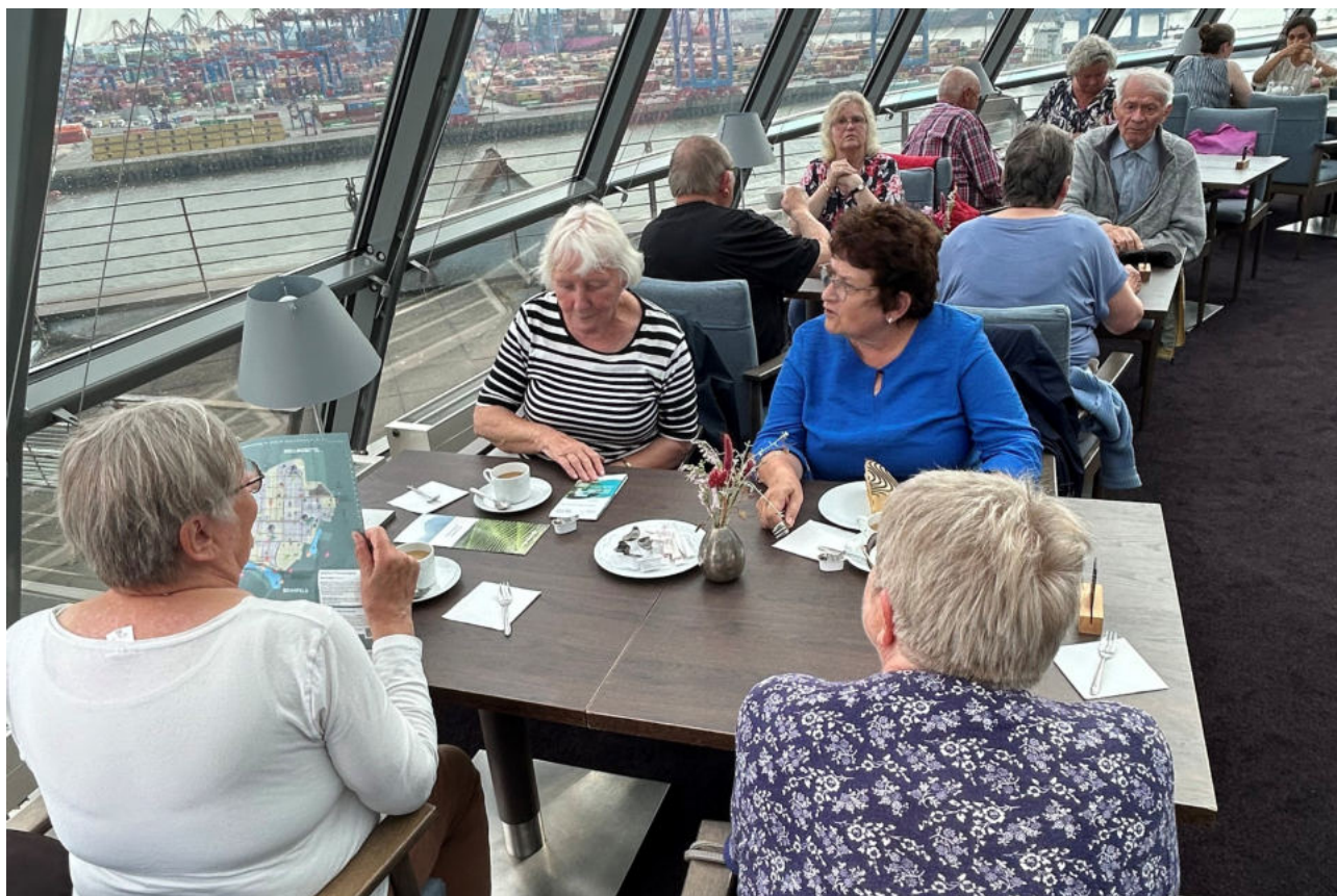
Die diesjährige Seniorenfahrt führte uns auf den Ohlsdorfer Parkfriedhof nach Hamburg.