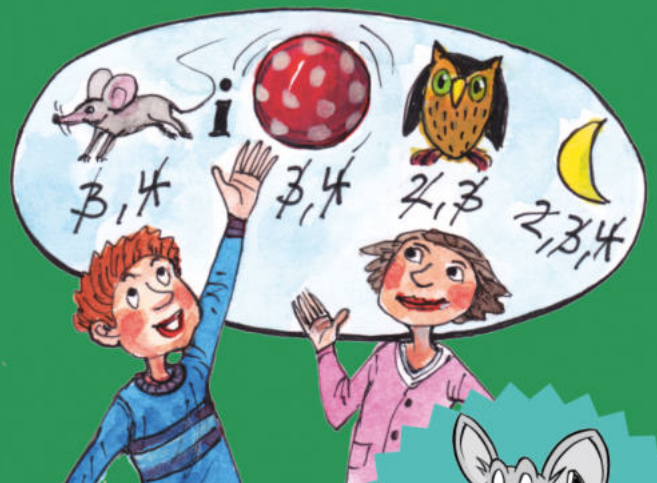
Auflösung: Max erzählt von einem MALBÄUM

Rätsel: Was hat Max gerade gesehen und erzählt davon? Löse das Bilderrätsel.