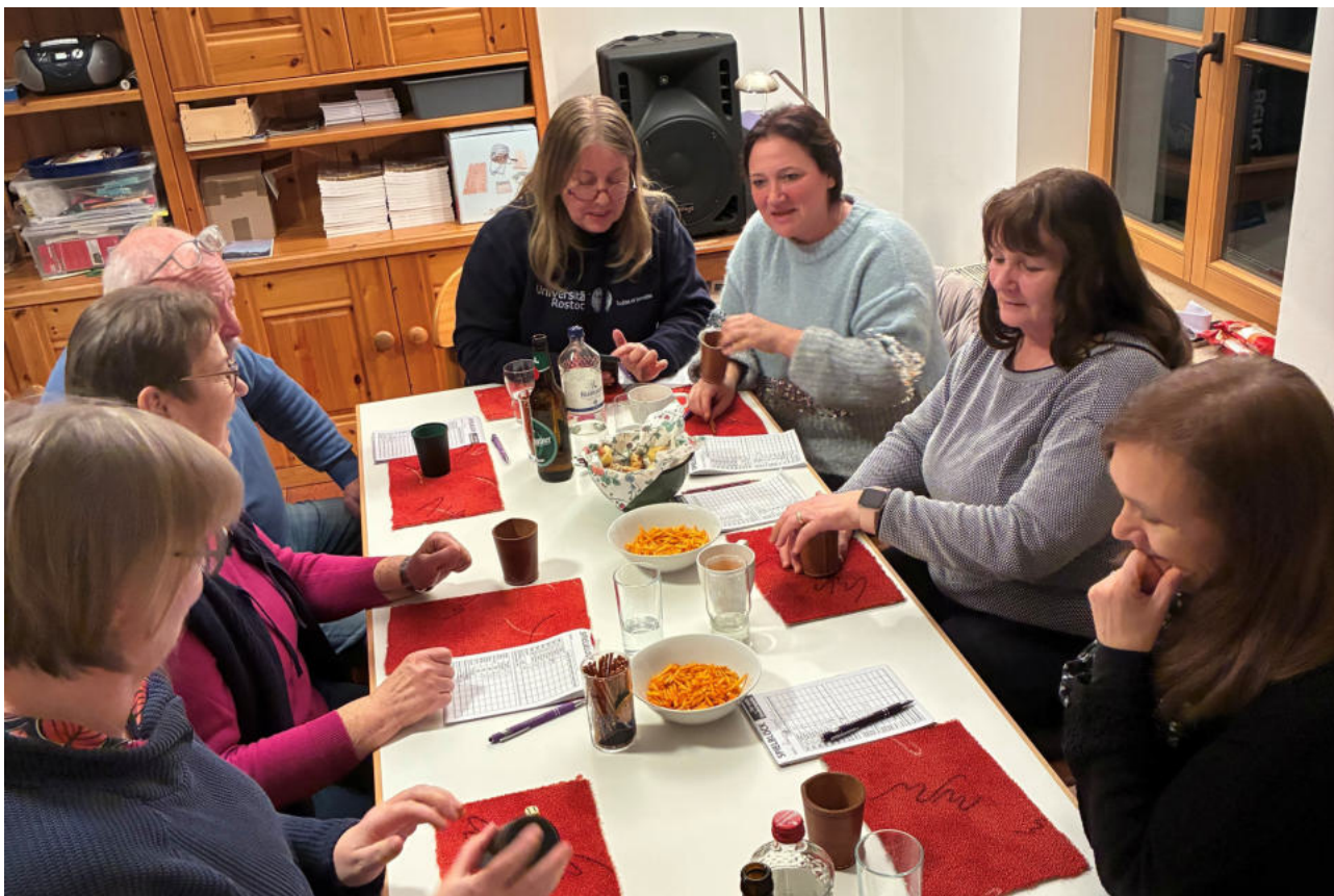
Einmal im Monat treffen sich Spielbegeisterte zum Kniffeln und Skatspielen im Pfarrhaus.