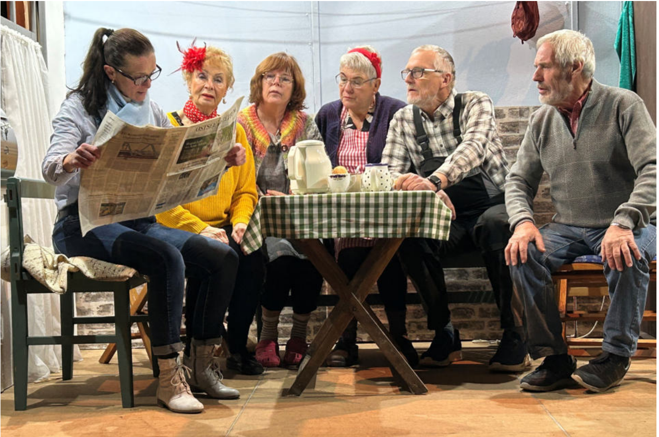
Auch im letzten Jahr begeisterte die Schönbarger Späldäl viele Besucher in der Selmsdorfer Sankt Marienkirche.