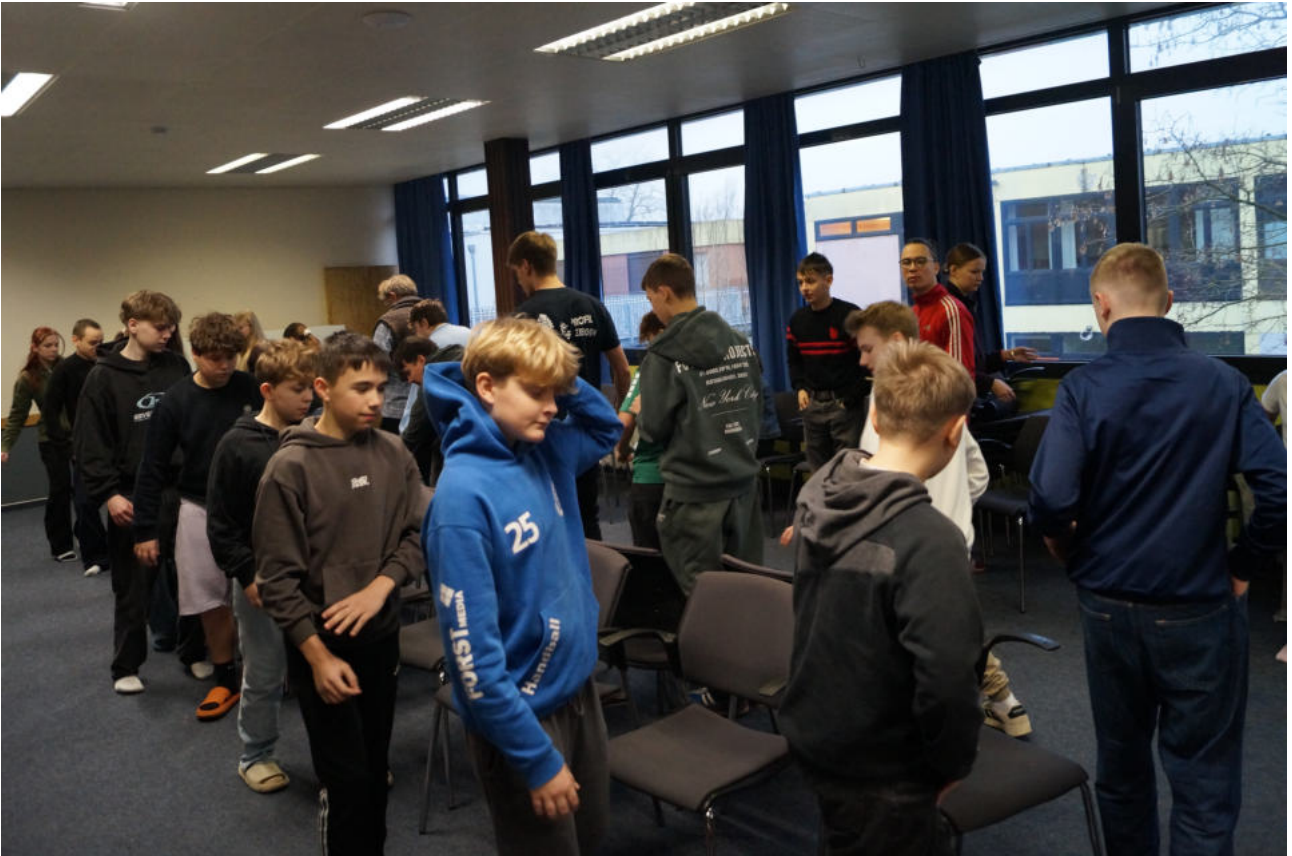
Die Konfirmanden der Kirchenregion Mecklenburg Nordwest hatten viel Spaß an dem gemeinsamen Wochenende in Ratzeburg.