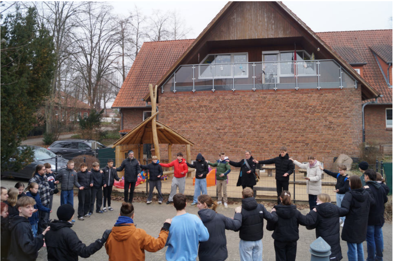
Zum Schluß gab es wie immer den Reisesegen für alle mit auf den Weg.