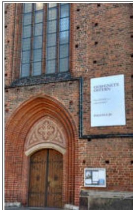
Letzter Kindergottesdienst vor Corona – Dom-Schneemann – Ostern