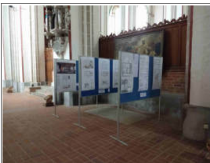
Ausstellen der Siegerentwürfe im Dom