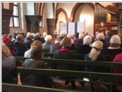
Vorstellen der Entwürfe für den Umbau des Domsaals