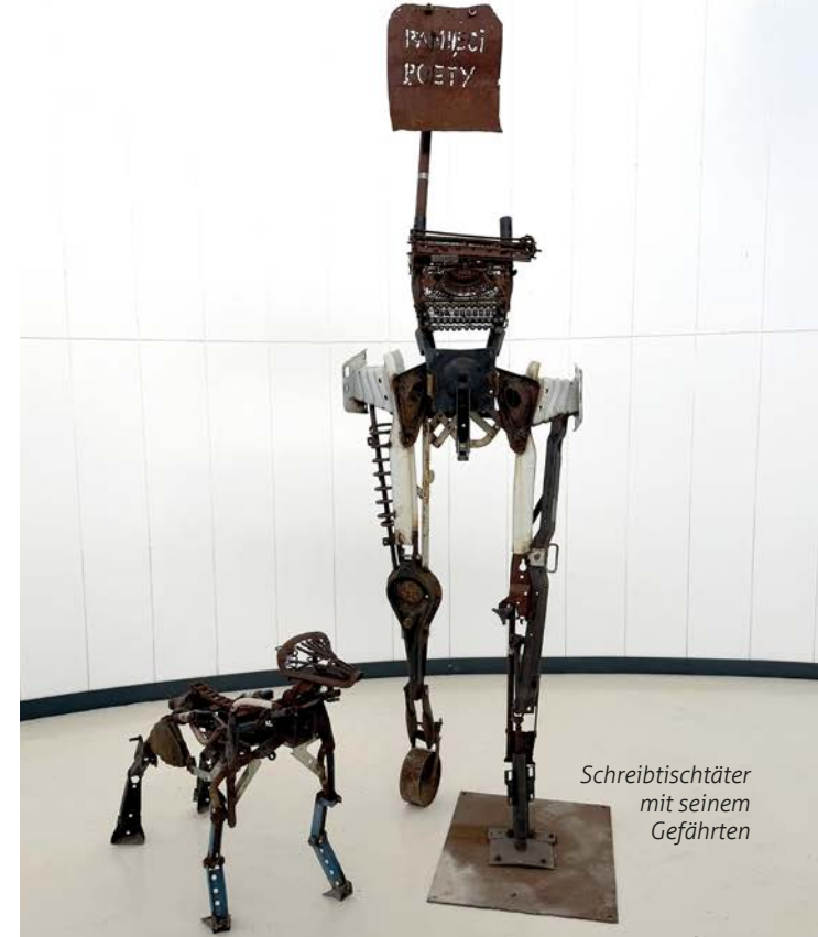
Schreibtischtäter mit seinem Gefährten

„Das Hauptthema meiner Arbeit ist der Mann. Vermeintliche Helden leben in der Vergangenheit, haben für die falsche Sache gekämpft. Ihre Medaillen widersprechen der aktuellen Realität.“