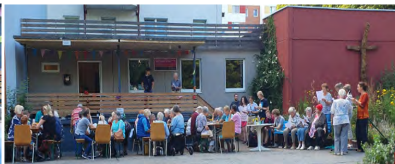
Kein Platz blieb leer....