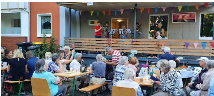
Der Posaunenchor aus Warnemünde