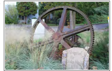
Königsrad der Kälberauler Mühle

Über ein System von Zahnrädern wird unter anderem das Königsrad angetrieben, sozu-sagen die „Zwischenschaltstation“ für die verschiedenen Aufgaben, die in der Mühle anfallen: mahlen, schroten, schälen, sieben usw. Wenn die Zahnräder richtig ineinandergreifen, setzen die Windmühlenflügel alles in Bewegung.