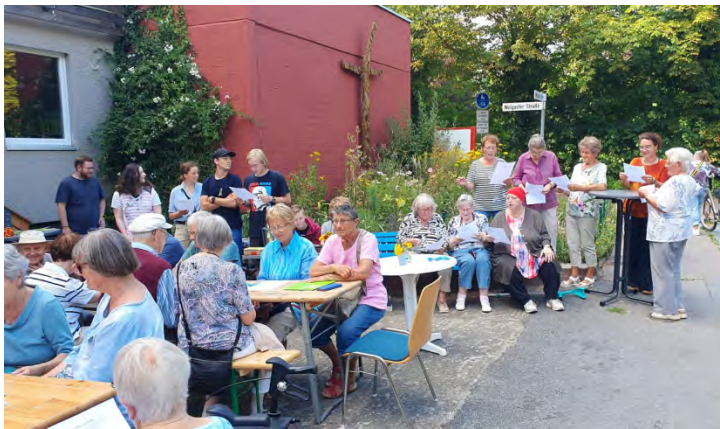
Der Singkreis eröffnet das Grillfest