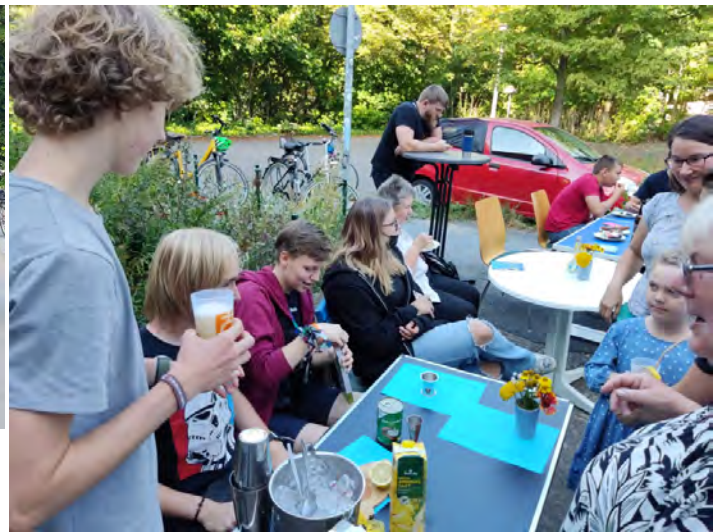
Die alkoholfreie Cocktailbar der JG „WaLi“