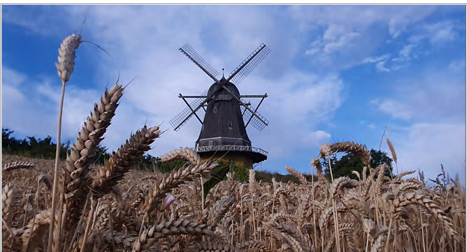
Gottes Mühlen mahlen langsam.