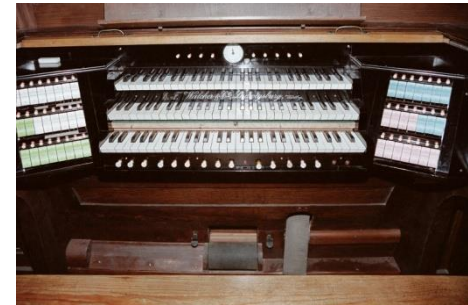
Walcker-Orgel von 1908

In Ihm sei's begonnen, Der Monde und Sonnen An blauen Gezelten Des Himmels bewegt.