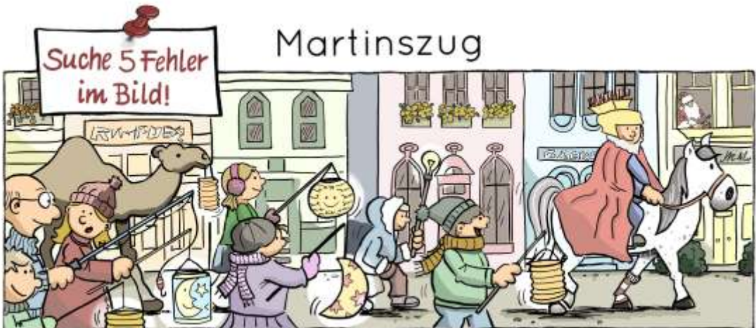
Kamel, Angel, Glühbirne, Ringelsöcke, Nikolaus

Die Kinder der Slütergemeinde laufen zusammen mit dem Hort der Michaelschule 16:30 Uhr an der Schule (Dierkower Damm 39) los.