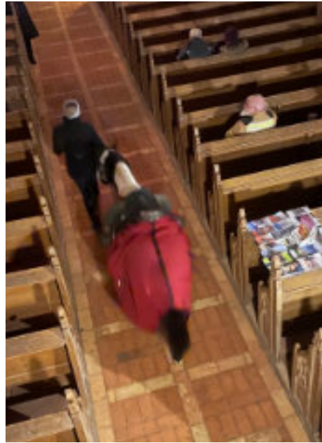
St. Martin in Prosen