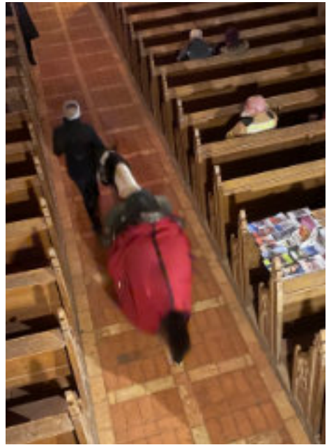
St. Martin in Proseken