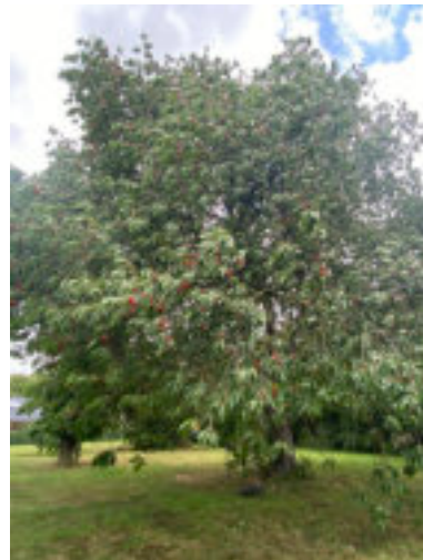
Kirschbaum im Pfarrgarten