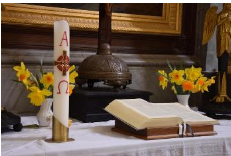
Altar zu Ostern, Schlosskirche Ivenack