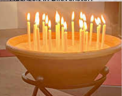
Kerzen bei Friedensandacht am 2. Mai in Neustadt