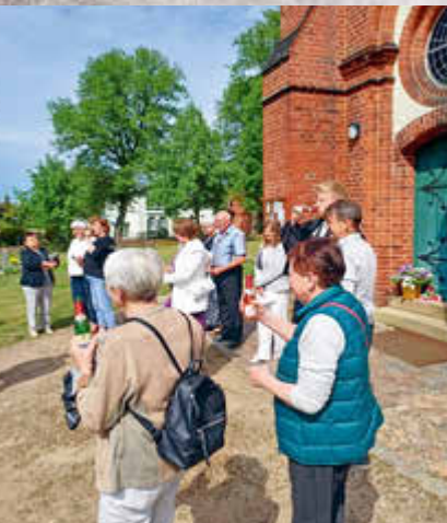
Sektempfang nach Goldener Hochzeit in Blievenstorf