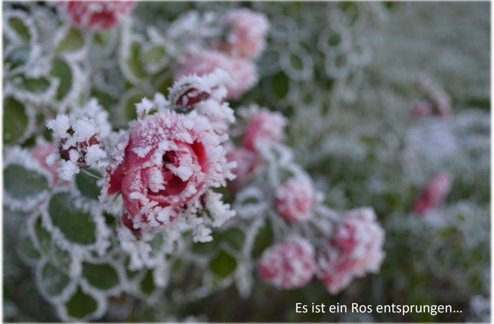
Es ist ein Ros entsprungen...

Es ist eines der schönsten Weihnachtslieder, das Lied von der Rose, die entspringt, wenn es kalt ist und dunkel: Mitten im kalten Winter. Auf eine leise und poetische Weise bringt es uns die Botschaft von der Geburt des Erlösers.