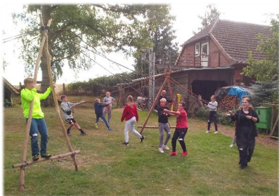
Konfis in Aktion bei der Restart Party Anfang September

Unser Konzept geht von der 5. bis zur 8. Klasse. In diesen vier Jahren treffen wir uns regelmäßig alle zwei Wochen, es gibt viele verschiedene Aktivitäten, Fahrten und Aktionstage. Wir spielen, diskutieren und essen gemeinsam. Themen sind die Lebensfragen der Jugendlichen, Fragen nach Gott, der Gemeinde und dem Glauben.