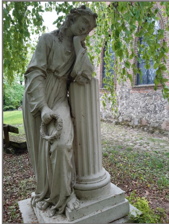
Trauernder Genius auf dem Friedhof in Kirchpoppentin

Am Nachmittag wird in der Zeit von 14:00 bis 16:00 Uhr auch die Stadtkirche geöffnet sein. Es erklingt Orgelmusik und es besteht die Möglichkeit, Gedenkkerzen zu entzünden. Vielleicht kann man das gut mit dem Weg zum Friedhof verbinden, denn viele statten an diesem Tag den Gräbern ihrer Angehörigen einen Besuch ab, halten inne und geben dem Gedenken Raum. Seien Sie auch herzlich in der Kirche willkommen!