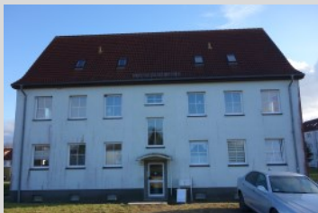
Das Neue Haus Zehna

18 - 19 Uhr Gitarren-unterricht für jung und alt