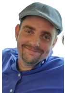
Friedhofsausschuss der Kirchengemeinde Lohmen

Und lassen sie sich einladen zu den Arbeitseinsätzen im Frühjahr auf unseren Friedhöfen!