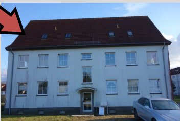
Das Neue Haus Zehna